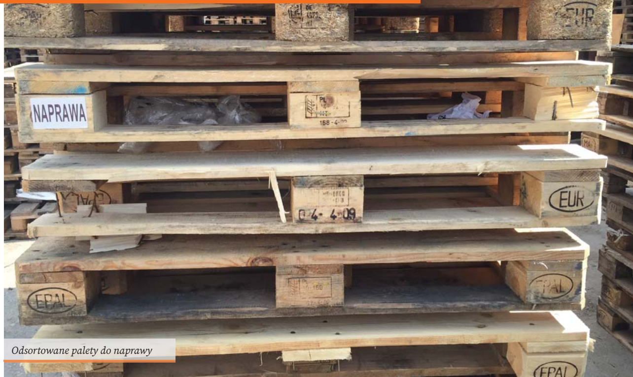
Odsortowane palety do naprawy