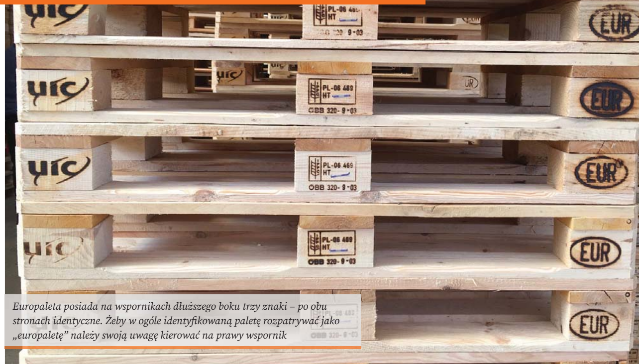
Europaleta posiada na wspornikach dłuższego boku trzy znaki – po obu stronach identyczne. Żeby w ogóle zidentyfikowaną paletę rozpatrywać jako „europaletę” należy swoją uwagę kierować na prawy wspornik