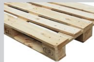
Przykładowe zdjęcie palety rocznej

Szary kolor palety, będący skutkiem naturalnego procesu starzenia się drewna, nie wpływa ujemnie na jej właściwości.