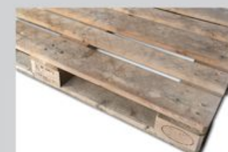
Przykładowe zdjęcie palety trzyletniej