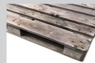
Przykładowe zdjęcie palety siedmioletniej

Palety EUR są produktem markowym i podlegają ochronie przez Ustawę Prawo Własności Przemysłowej!