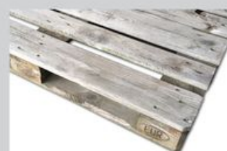
Przykładowe zdjęcie palety pięcioletniej